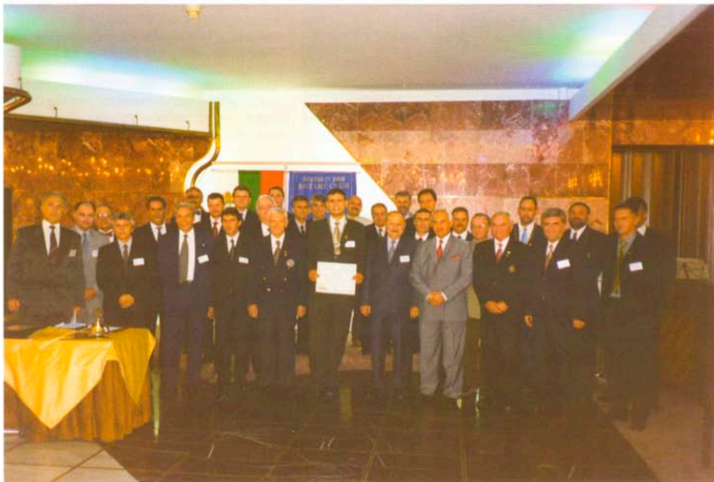
Новочартираният клуб и гостите

Благодаря за вниманието и Ви желая незабравима Ротарианска вечер.